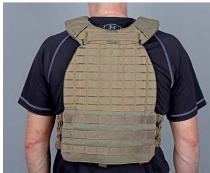
Ausrüster wie 5.11 Tactical aus den USA oder Tasmanian Tiger aus Deutschland stellten ihre spezialisierten Produkte vor. Den neuen „TacTec“ Plattenträger von 5.11 Tactical konnten wir bereits testen und in caliber 9/2013 präsentieren.