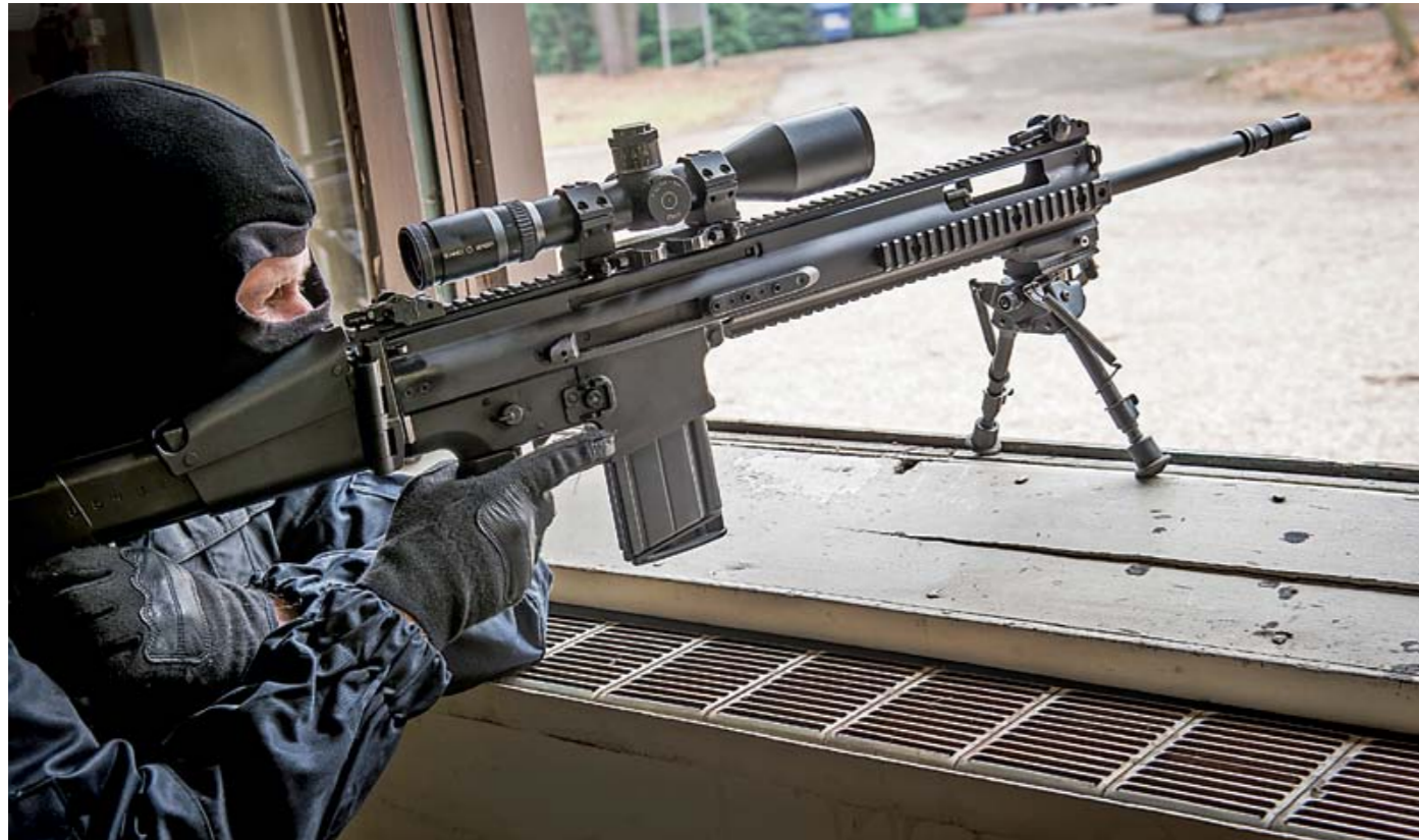
TeutoDefence Behördentage 2013: Fachbesucher aus der behördlichen Waffenwelt gaben sich in Bad Oeynhausen ein Stelldichein, um Ausrüstung namhafter Hersteller zu begutachten. Hier das in caliber 7-8/2013 ausführlich vorgestellte halbautomatische Scharfschützengewehr FN SCAR H PR in 7,62x51 mm NATO in Aktion.

In der verträumten Kurstadt Bad Oeynhausen trafen sich am dritten und vierten September dieses Jahres zum nunmehr vierten Male geladene Experten und Aktive aus Militär-, Polizei- und Sicherheitskreisen zur kleinen, feinen TeutoDefence Hausmesse mit rundem Rahmenprogramm.