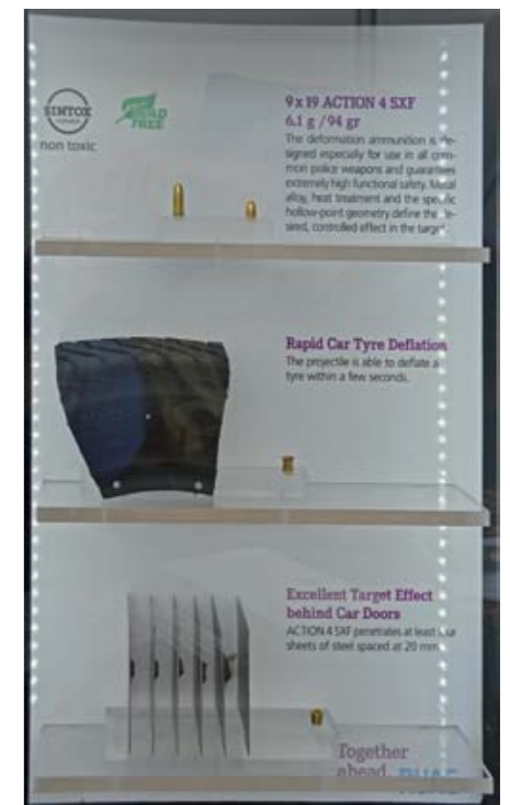
Prominente Munitionshersteller und Behördenlieferanten aus Europa, wie MEN aus Deutschland, RUAG aus Schweiz und Deutschland sowie Nammo aus Finnland, zeigten ihre spezialisierten Patronen für den Einsatz bei Militär und Polizei.