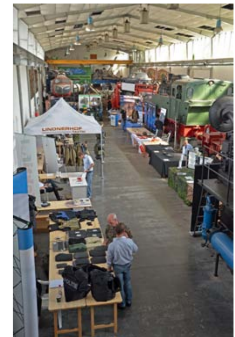
Vogelperspektive: Blick in eine der beiden Ausstellungshallen von TeutoDefence.