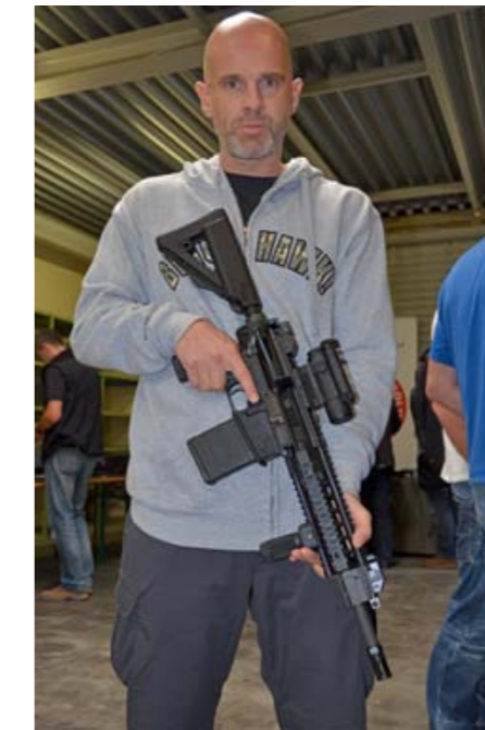
Das SIG 716 Selbstladegewehr im leistungsstarken Standardkaliber .308 Winchester ist wie die MPX auf dem europäischen/deutschen Markt leider noch nicht erhältlich.