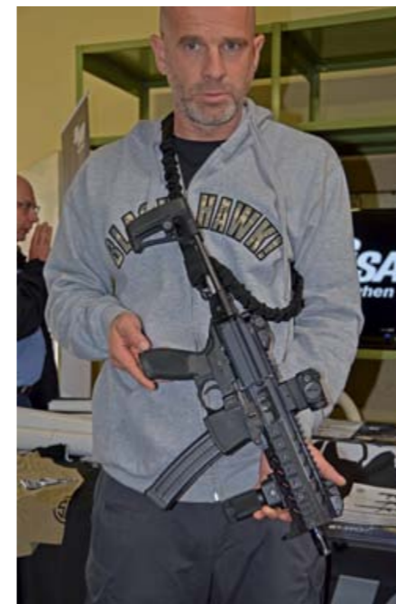
SIG Sauer hatte unter anderem die moderne Multikaliber-Maschinenpistole MPX mit im Gepäck, die wir das erste Mal auf der SHOT Show dieses Jahres sichten konnten.

...war das Trockentraining mit fordernden Handhabungsdrills rund um „das“ weltweit verbreitete, russische Sturmgewehr AK-47 (sowie seinen Varianten AK-74, AKS-74U, AK-101, AK-107 und Zi-